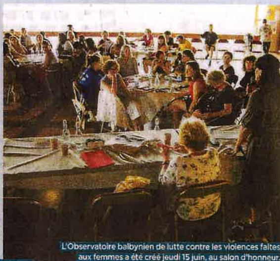
L'Observatoire balbynien de lutte contre les violences faites aux femmes a été créé jeudi 15 juin, au salon d'honneur.