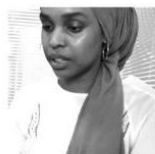
AÏMANA Sistachérie Volontaire SC